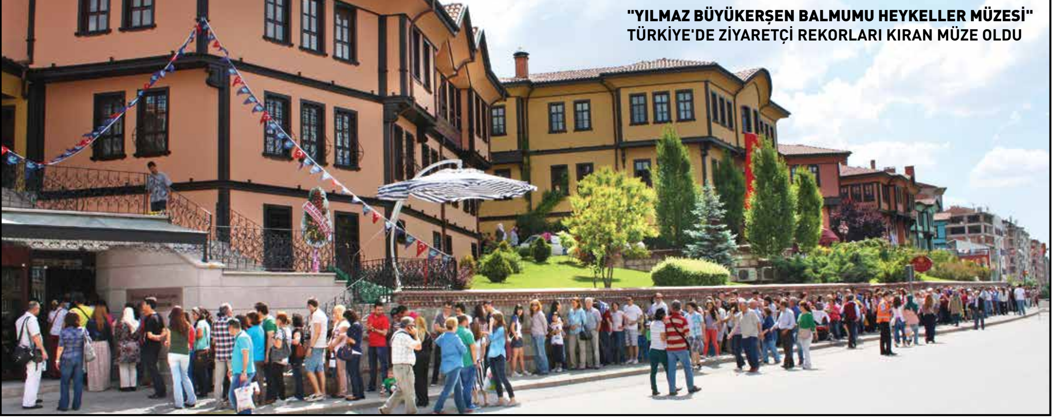
"YILMAZ BÜYÜKERŞEN BALMUMU HEYKELLER MÜZESİ" TÜRKİYE'DE ZİYARETÇİ REKORLARI KIRAN MÜZE OLDU

olacağını düşünmüyordum. Bu hareketlilik bugün şehirde hizmet sektörünü de hızlı bir büyüme sürecine soktu. Eskişehir'in turizm alanında değerine değer katacak olan yeni projelerimiz var.