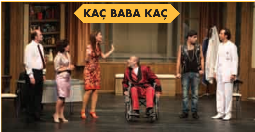
KAÇ BABA KAÇ